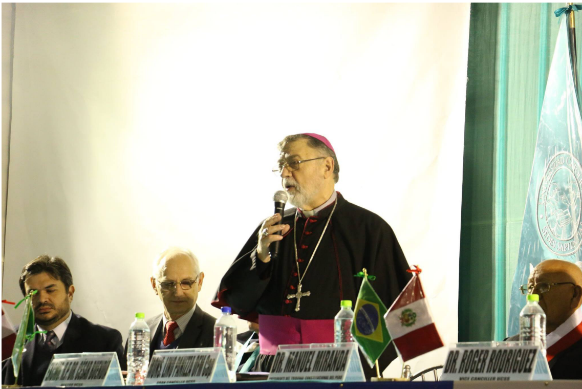
Palabras de Inauguración del Congreso por parte del Gran Canciller de La Universidad.