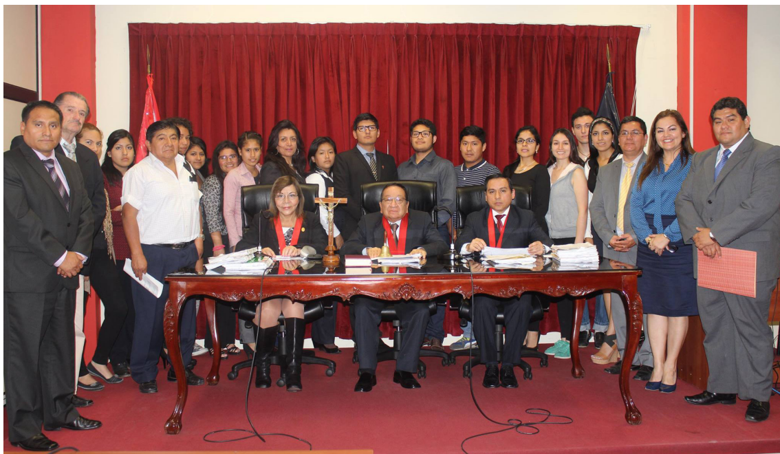
Visita guiada a la Corte Superior de Justicia del Poder Judicial de Lima Norte.