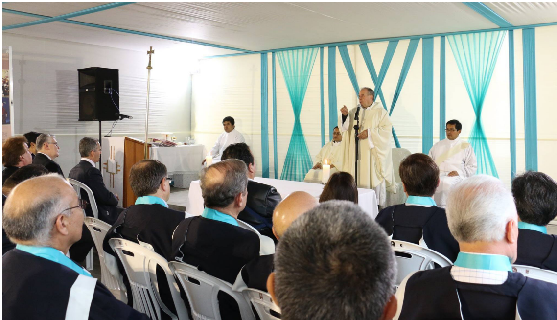
Acto Inaugural con la celebración de la Santa Misa.