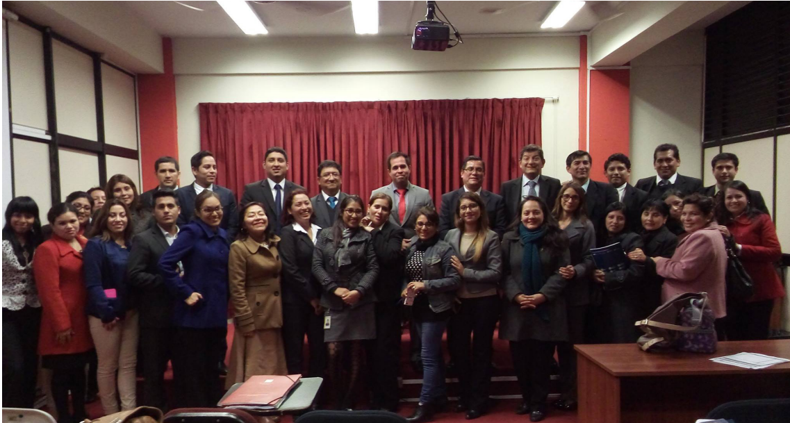
Capacitación al personal del Poder Judicial de la Corte Superior de Justicia de Lima Norte.