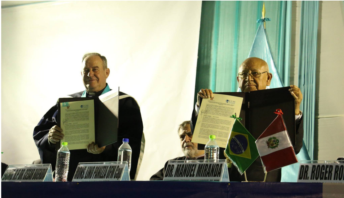
Celebración del Convenio Interinstitucional entre la Universidad y el Tribunal Constitucional.