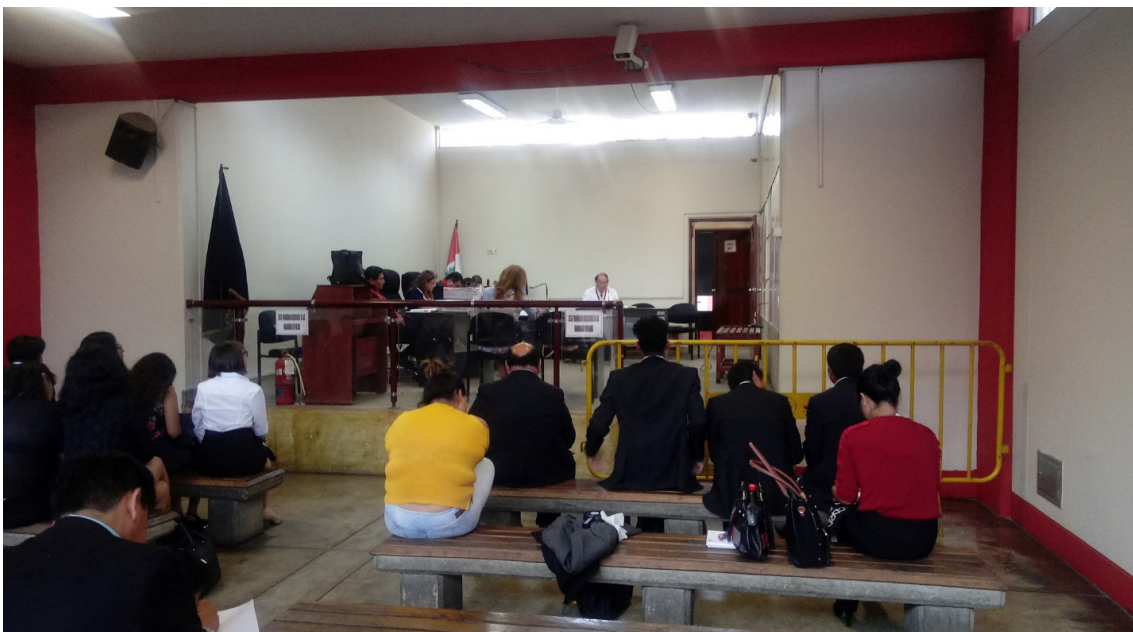
Visita guiada al Penal de Lurigancho para participar en las audiencias de los reos en cárcel.