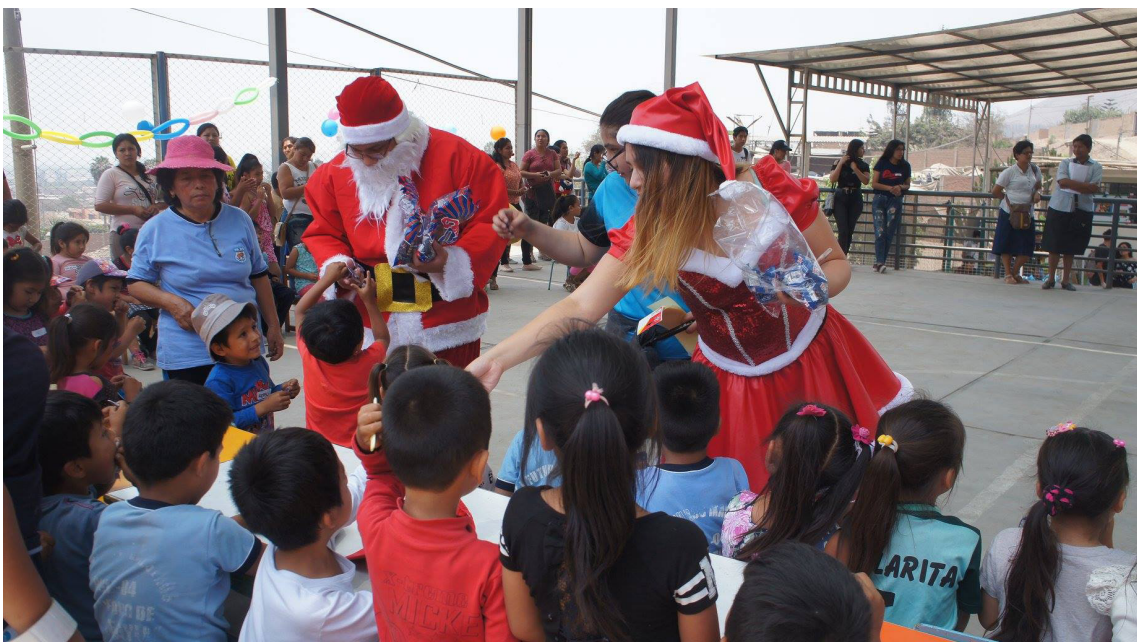
Celebración de la Navidad 2019, con los niños del Asentamiento Humano San Pedro de Carabayllo.