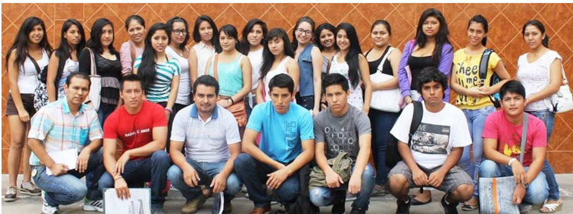
Primera promoción de ingresantes (ciclo 2014-I).