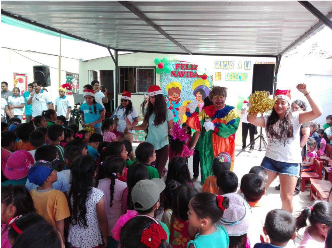
Celebración de la Navidad 2018 con los niños de Pachacutec, Ventanilla, de diversos asentamientos humanos.