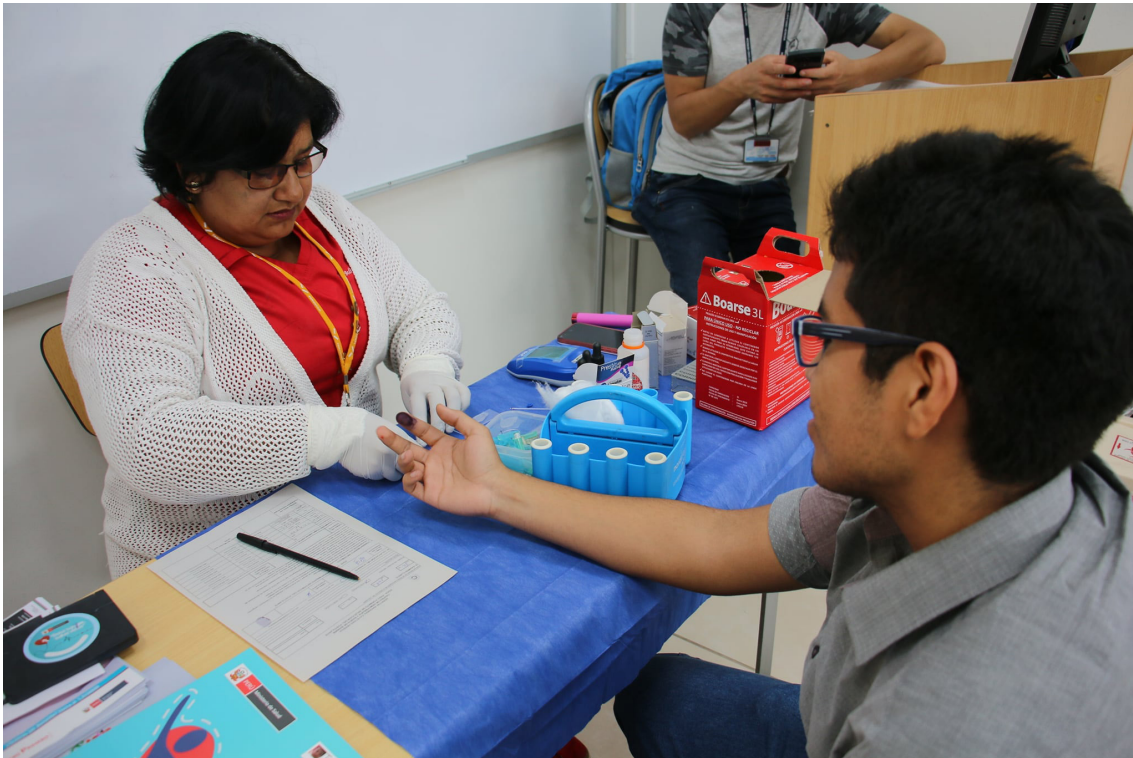
Campaña de donación de sangre con personal del Banco de Sangre del Hospital Cayetano Heredia.