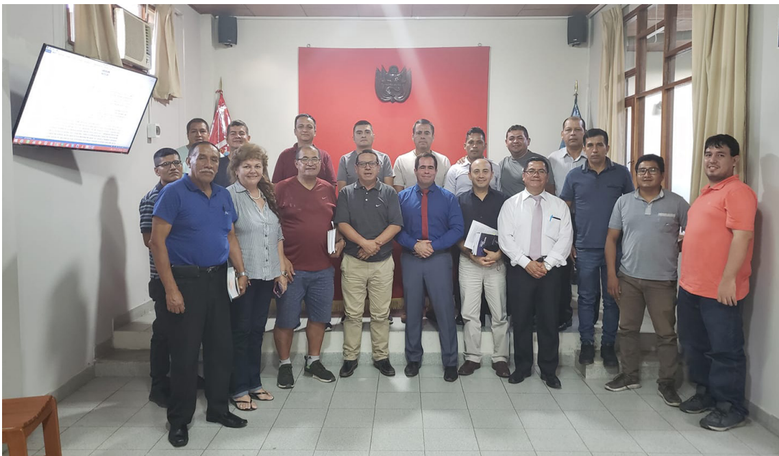
Capacitación al Fuero Militar Policial en la ciudad de Iquitos.