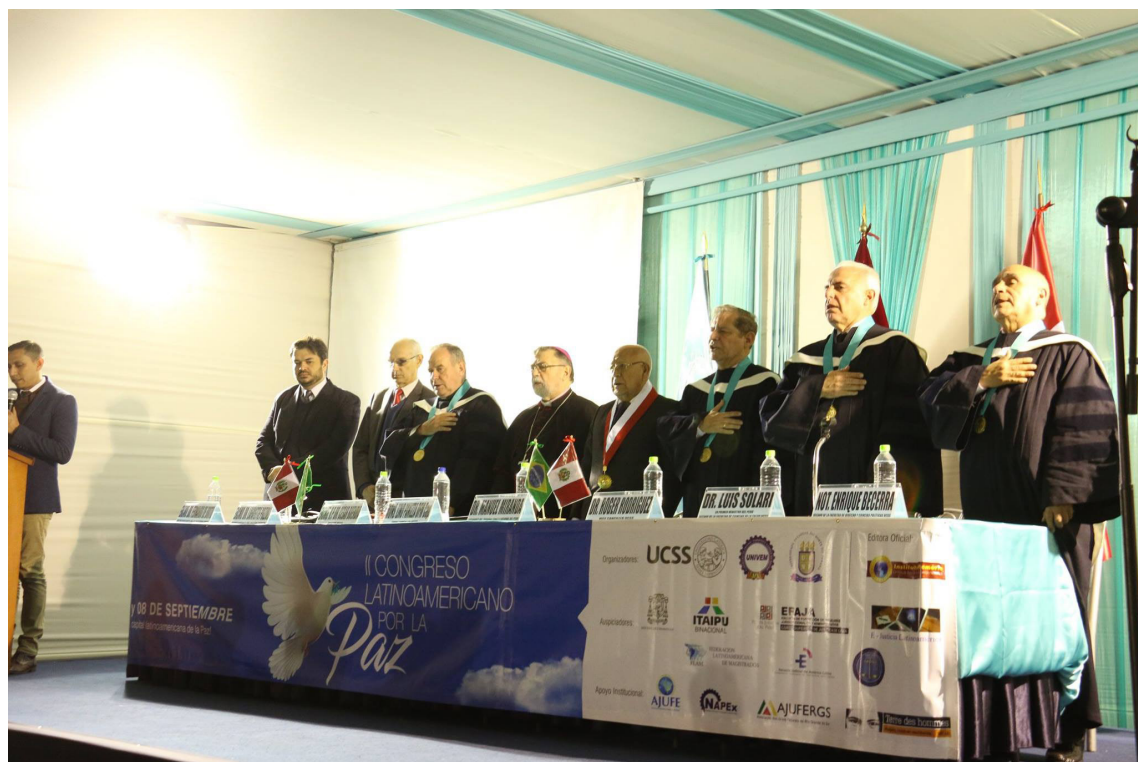
Ceremonia de Inuguración con la participación de representantes de diversas instituciones.