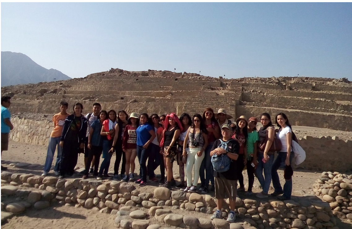
Visita guiada al centro Arqueológico Cultural de Caral, Huacho.