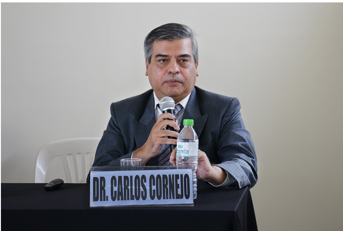
Conferencia Magistral del Maestro Carlos Cornejo Guerrero sobre La Marca en el Perú.