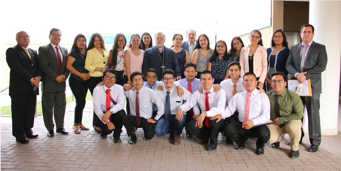
Participación de los alumnos de la filial Rioja, Nueva Cajamarca en la Semana de la Facultad.