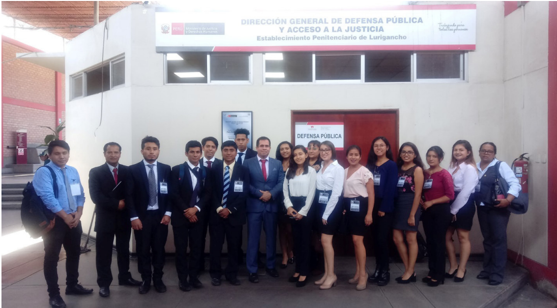
Visita guiada al Penal Castro Castro para participar en las audiencias de los reos en cárcel.