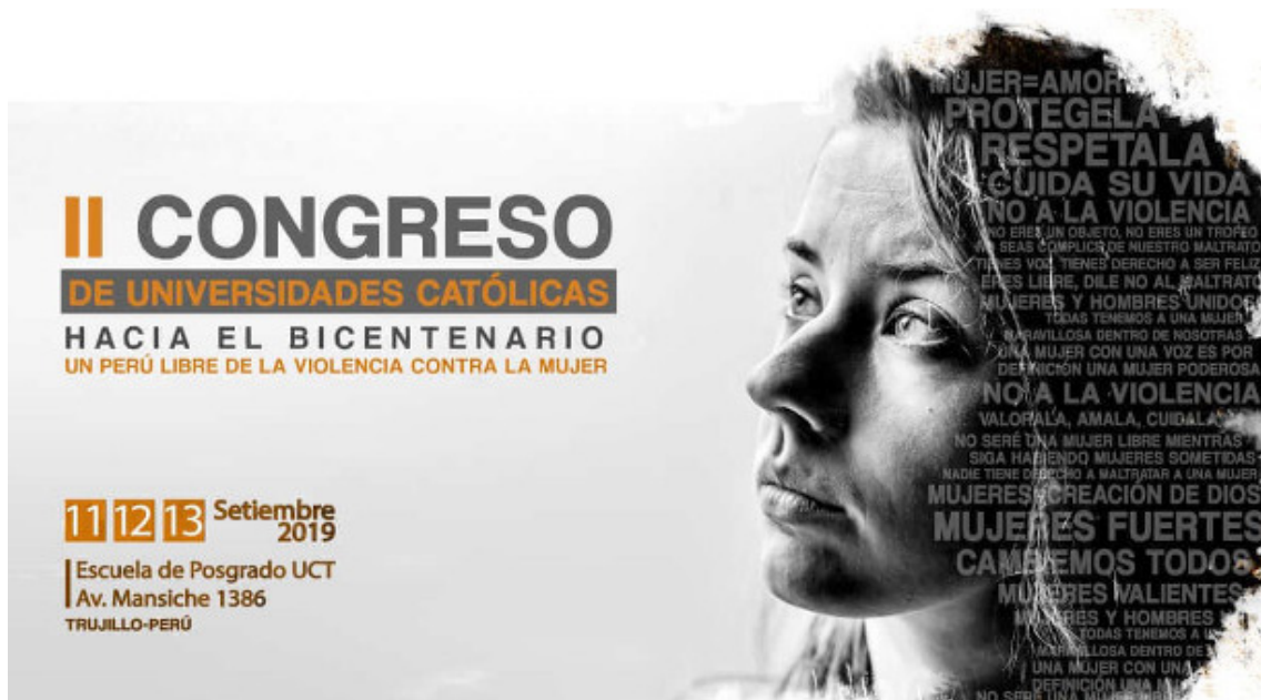
Afiche del II Congreso Nacional de Universidades Católicas realizado en la ciudad de Trujillo.