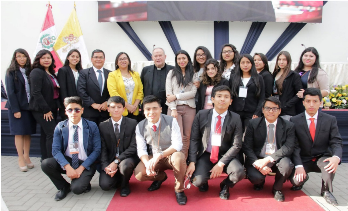
Alumnos de la Facultad de Derecho que participaron en el II Congreso de Universidades Católicas.