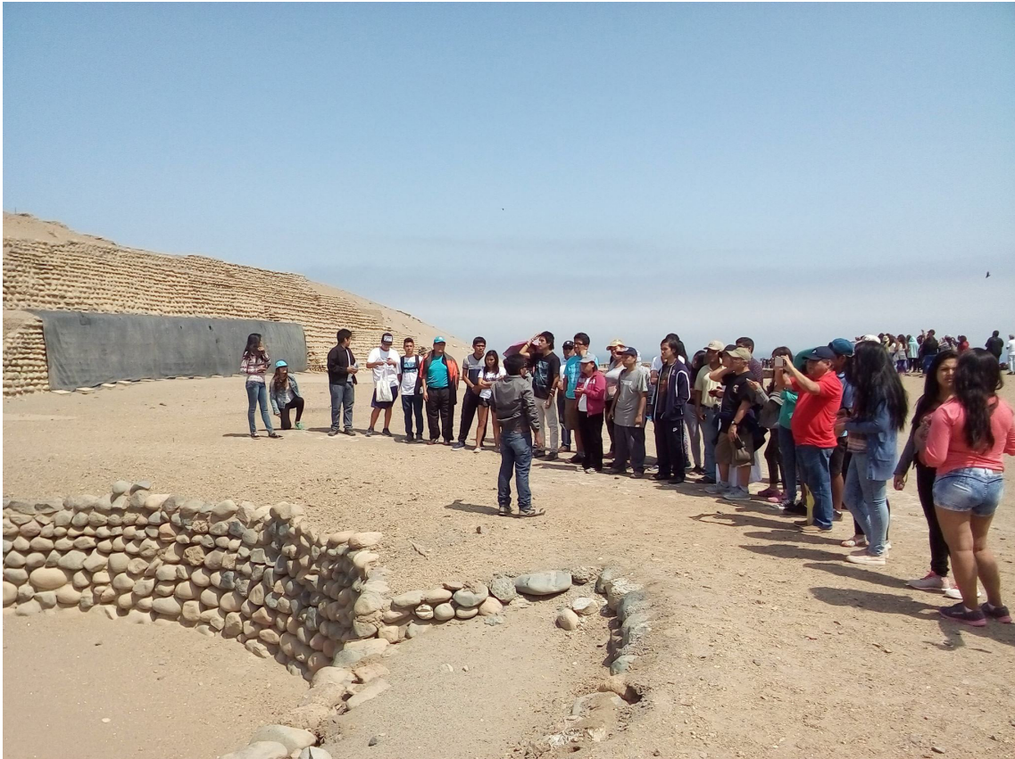
Visita guiada al Centro Arqueológico Cultural Bandurrias, Huacho.