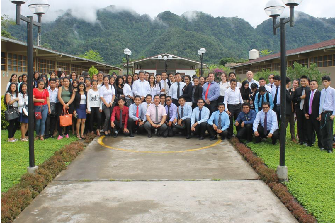
Primera Promoción de ingresantes a la Facultad de Derecho en la Filial Rioja, Nueva Cajamarca.