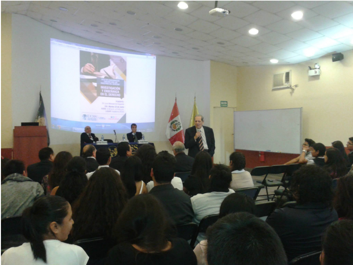
Conferencia Magistral con el Dr. Moisset de Espanes (Argentina).